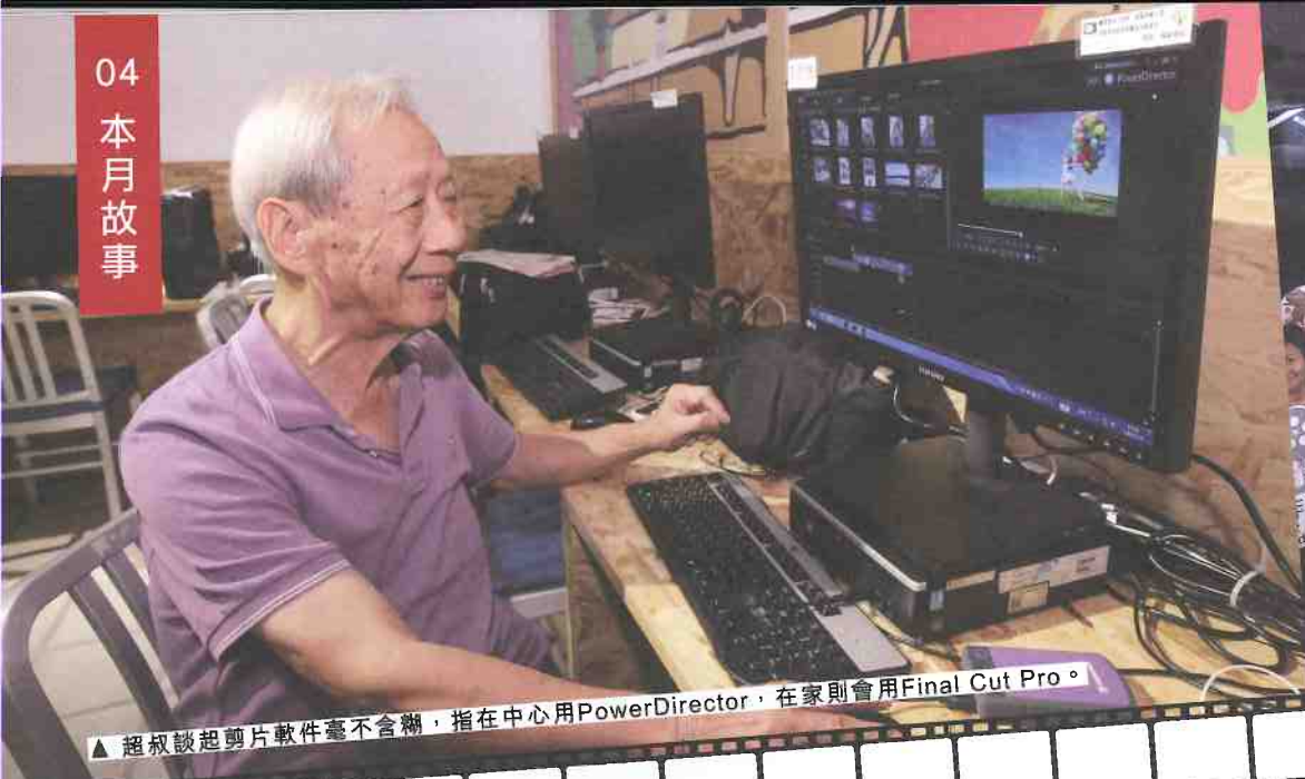
▲ 超叔談起剪片軟件毫不含糊，指在中心用PowerDirector，在家則會用Final Cut Pro。